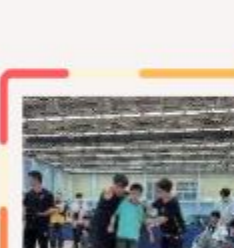
黃逸明 - 金牌