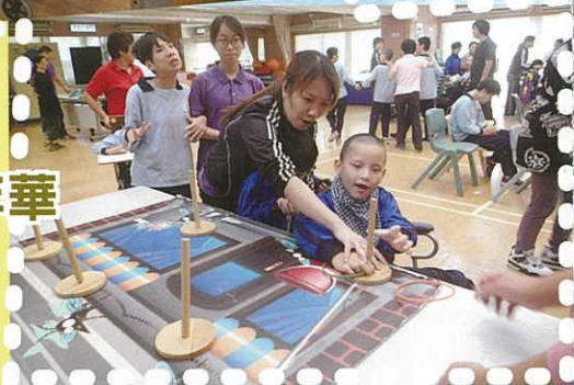
自理科： 衛生嘉年華