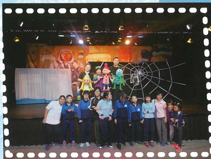
圖書館欣賞話劇：小騎士，大冒險