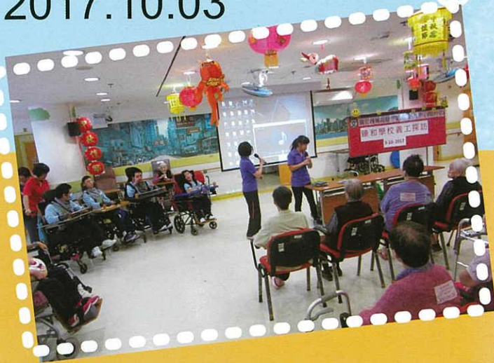
高中學生義工隊探訪護養院