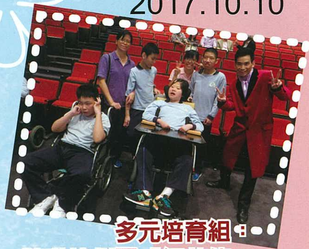
多元培育組： 跨啦啦劇團「紅花俠」