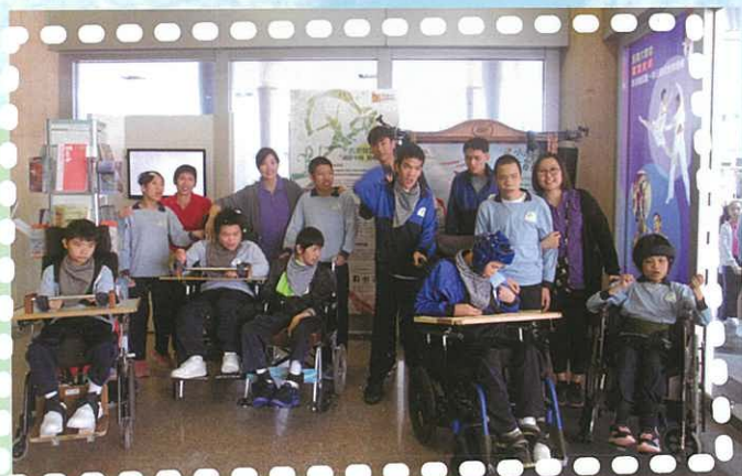
音樂科：小夜曲弦樂音樂會