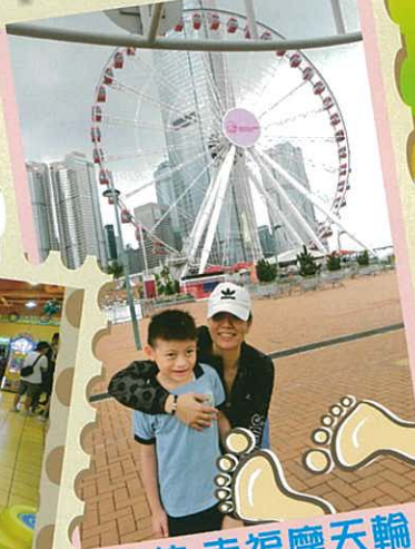
心信-幸福摩天輪 (挑戰海陸空)