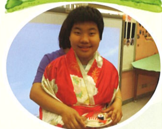
心秀- 體驗外國美食文化