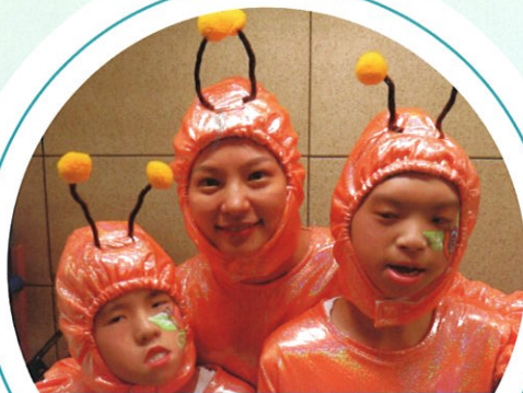
最具視覺效果 銀獎