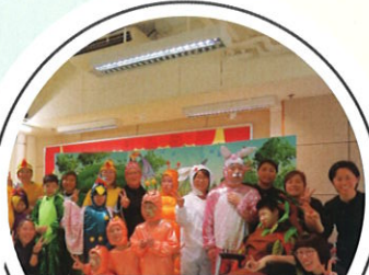
最佳整體演出 金獎