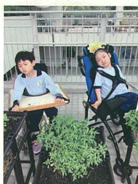
心正--燒烤樂X悠悠閒