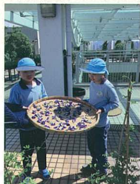
心忠--小農夫體驗日